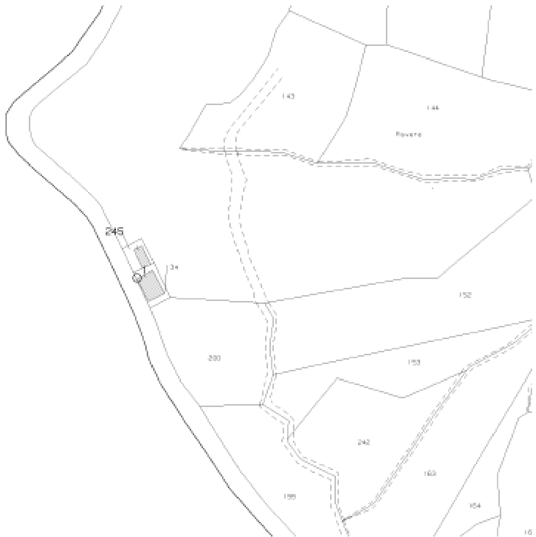
Stralcio Foglio di mappa (non in scala)